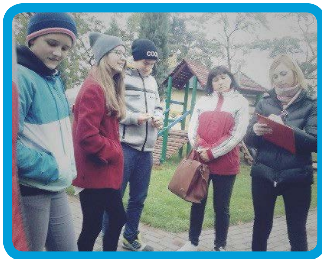
Дослідницька прогулянка в Лісєві

Також рекомендуємо використовувати скриньки думок/ідей стосовно якоїсь проблеми. Її найбільшим достоїнством є те, що вона дозволяє дотримуватись більшої анонімності. Їх можна одночасно розмістити в кількох місцях, так, щоб зібрати думки різних молодіжних середовищ. Скриньки, так само, як інші методи варто постійно презентувати, тобто забезпечити, щоб хтось надавав інформацію стосовно того, навіщо вони виставлені та як їх використовувати. У випадку використання цього методу варто біля скриньки розмістити плакат – інформацію, яка заохочує користуватись скринькою.