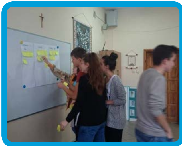
Стіна, що говорить у Плужниці

Дослідницькі прогулянки було проведено в Лісєві на території «йорданкі». Прогулянки організували молоді люди і вони їх вели. Вони запросили на ці прогулянки своїх колег та подруг. Разом вони замислились про те, що їм подобається, а що перешкоджає на цій території. Що важливо – обговорення про те, як можна загосподарювати цю територію відбувалося прямо на місці. Однією з цікавих пропозицій є створення столів з лавками, за якими учні в теплі дні на свіжому повітрі могли б готуватись до уроків в очікуванні автобуса («йорданкі» знаходяться біля зупинки).