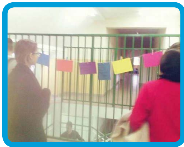
Запитання на шпагаті у Плужниці

До стіни (важливо, щоб усі мали до неї легкий доступ) кріпимо аркуш великого сірого або білого паперу з написом, який розміщений нагорі: «Стіна, що говорить» і запитанням, на яке шукаємо відповідь. Можна роздати 5-7 самоклеючих карток і попросити зафіксувати на них свої думки, а потім приклеїти їх до нашого аркуша. Можна також попросити записувати свої думки безпосередньо на паперовій «стіні». Також в цьо-